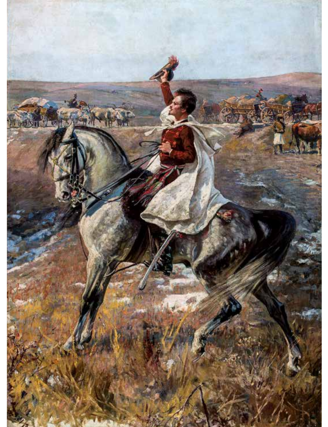
Sándor Petőfi hoch zu Roß

Gefühlen und Ideen zu verbinden. Angesichts seiner Proteus-Fähigkeit ist Petőfi also ein hervorragender Einstiegspunkt, über den die ungarische Literatur zugänglich gemacht werden kann. Der Dichter sieht und weiß, versteht und kann daher vermitteln.